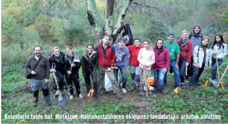
Boluntario talde bat, Muskizen, Hamabostaldiaren ekimenaz landatutako arbolak aldatzen

Azkenaldian irmo ari da Donostiako Musika Hamabostaldia izadiaren aldeko neurriak sustatzen. Hitzez, eta, batez ere, ekintzaz. Iazko uztailearen 15ean hiru ziurtagari erdietsi zituen; ingurumenaren aldetik kudeaketa egokia egiten duela erakusten dute hirurek. AENOREk eta IHOBek onetsitakoak dira bi ziurtagiri, eta hirugarrenak, berriz, agerian uzten du jaialdiaren ondorioz egindako CO 2 isurketen ordezkari ingurumenaren aldeko neurriak hartzeko borondatea. Hainbat ekintza egin dira dagoeneko egitasmo horri atxikita; izan ere, iaz Antzinako Musika zikloaren ondorioz egindako CO 2 isurketak konpentsatzeko, arbola landaketak egin dira Oiartzunen eta Muskizen. Ez da jarduera berria izan Hamabostaldiarentzat, 2010eko edizioan Chillida-Lekun egindako zikloan ere prozedura bera jarraitu zen; orduko hartan, hala ere, Euskal Herritik kanpo egin ziren arbola landaketak, Mexikon. Aintzindaria da Musika Hamabostaldia naturaren aldeko konpromisoan. Jaialdiko lan taldeak protokolo zorrotzak jarraitzen ditu ingurumenaren aldetik portaera egokia izateko, eta, bide batez, Hamabostaldiarekin lotura duten eragileei ere ekimenarekin bat egiteko deia egiten zaie. Esaterako, jaialdian parte hartzen duten artista guztiei ematen zaie hartutako erabakien berri.